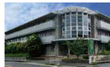
藤本病院 関連施設