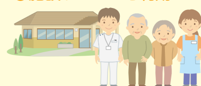
「寝屋川市介護保険利用ガイドより」

認定された要介護度によって使えるサービスの種類や回数が決まります。 詳しくは藤本病院居宅介護支援事業所までご相談ください。 迅速に対応させていただきます。