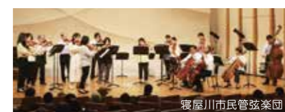
※写真は以前の様子です。